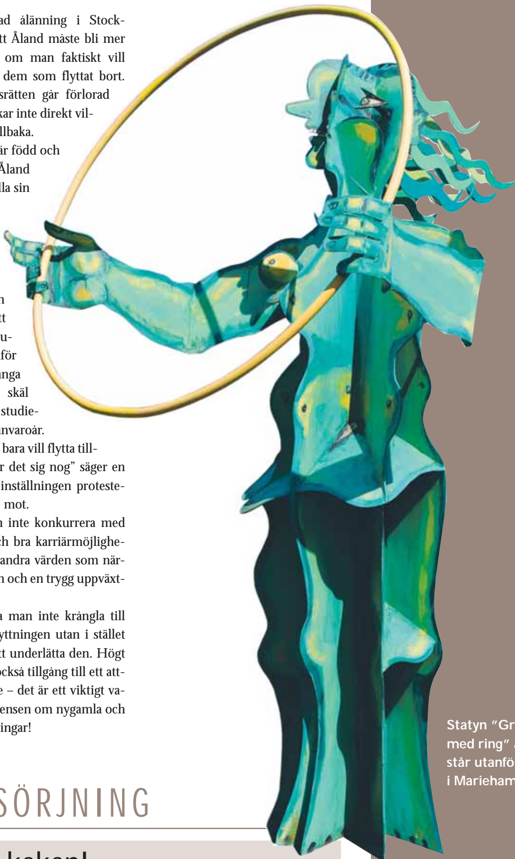
Statyn "Grön kvinna med ring" av Timo Solin står utanför Mariebad i Mariehamn.

// Vissa värden är eviga oavsett vilken generation man tillhör. //